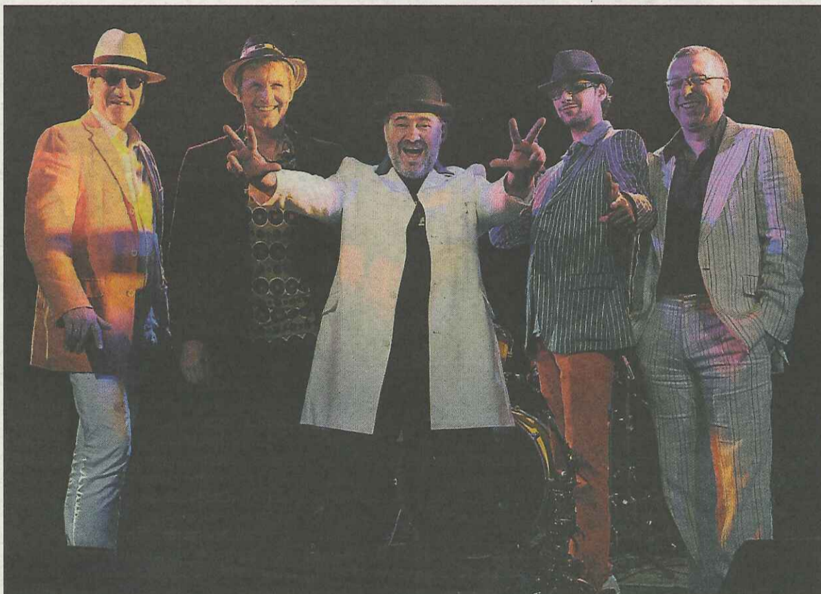
Carlama Orkestar: „Met eigen nummers onderscheiden we ons van andere Balkanbands.”